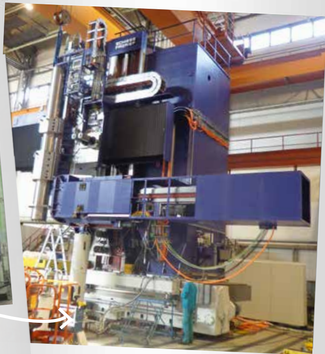
Generalüberholung einer Karusselldrehmaschine 80 DV Fabrikat SCHIESS FRORIEP