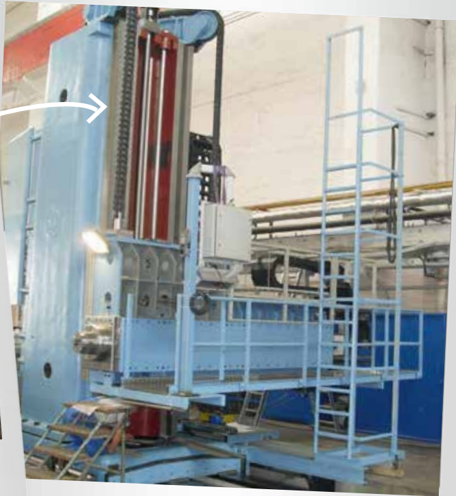
Komplette Modernisierung eines Bohrwerks Fabrikat SKODA