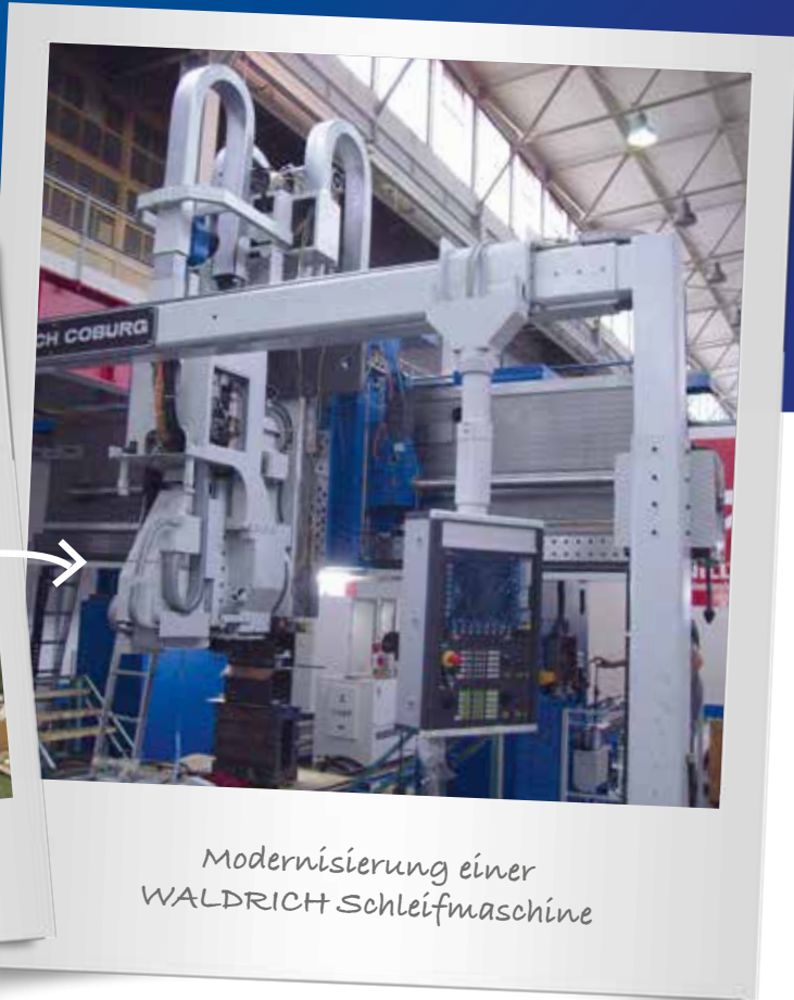
Modernisierung einer WALDRICH Schleifmaschine