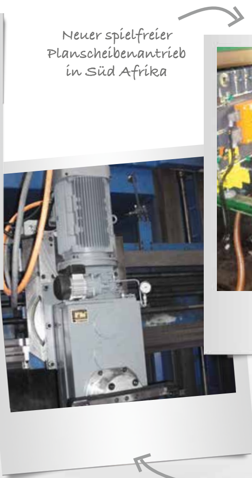
Neuer spielfreier Planscheibenantrieb in Süd Afrika